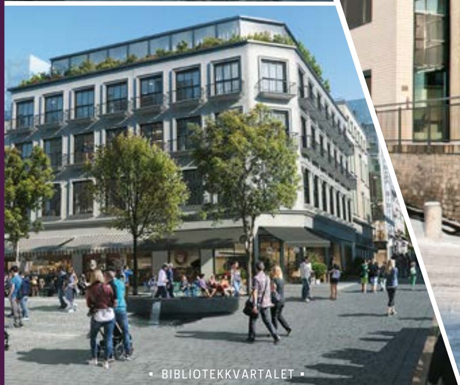
▪ BIBLIOTEKKVARTALET ▪