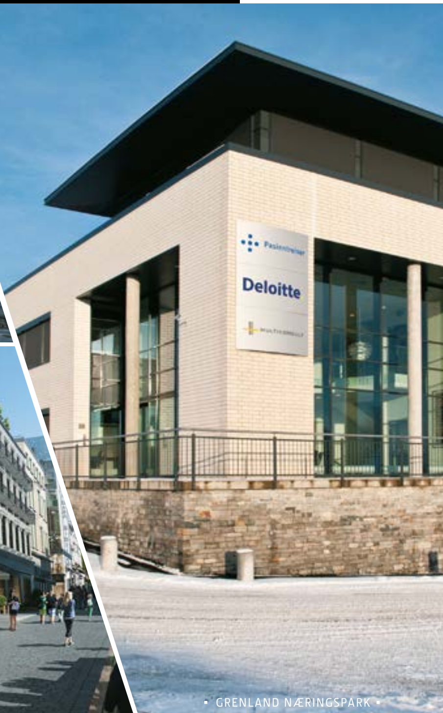
▪ GRENLAND NÆRINGS PARK ▪