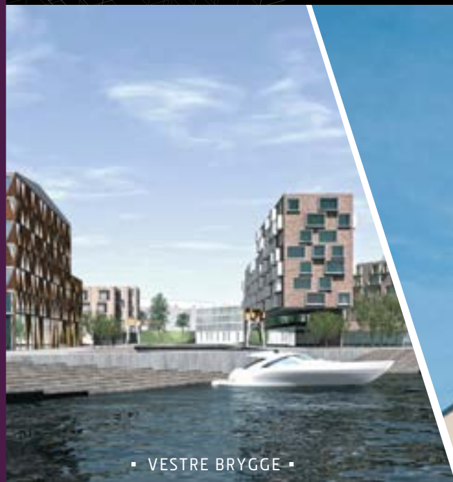
▪ VESTRE BRYGGE ▪